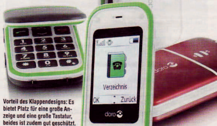
Vorteil des Klappendesigns: Es bietet Platz für eine große Anzeige und eine große Tastatur, beides ist zudem gut geschützt.

Das liegt teilweise an der vergleichsweise großen Ausstattung. So bietet das Easy Phone als einziges Modell im Test Bluetooth. Auch MMS-Nachrichten lassen sich mit dem Handy empfangen, zudem gibt es ein UKW-Radio, das sich mit dem beiliegenden Stereo-Headset betreiben lässt. Ein Wecker, der auch bei ausgeschaltetem Gerät funktioniert, sowie ein Taschenrechner, ein einfacher Kalender und zwei Spiele gehören ebenfalls zum Funktionsumfang.